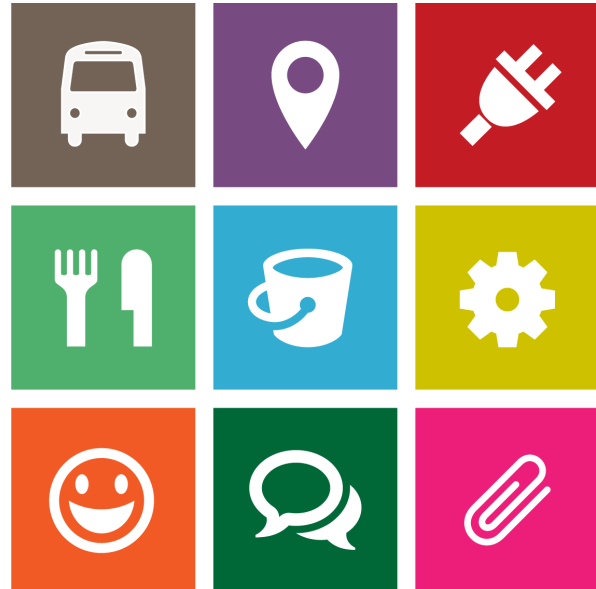
Green Events Themenbereiche – von A wie Anreise bis W wie Wasserverbrauch

Die steirische Landesverwaltung möchte mit dem „Green Events Veranstaltungsstandard“ ihrer ökologischen, ökonomischen und sozialen Vorbildwirkung gerecht werden!